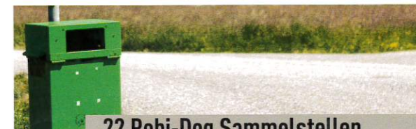
22 Robi-Dog Sammelstellen