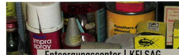
Entsorgungszentrum | KELSAG

2024 findet keine Sondermüllsamm lung statt.