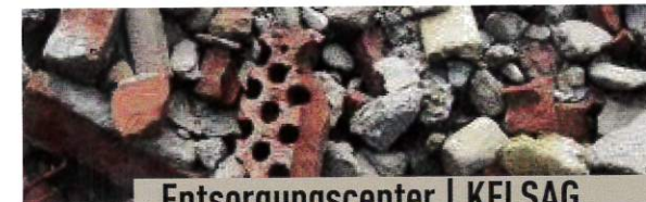
Entsorgungszentrum | KELSAG

können gegen Gebühr beim Entsorgungszentrum Laufen oder der KELSAG entsorgt werden.