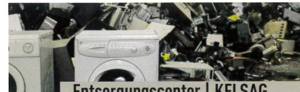
Entsorgungszentrum | KELSAG

Das Entsorgungszentrum Laufen und die KELSAG nehmen Elektrogeräte ebenfalls kostenlos entgegen.