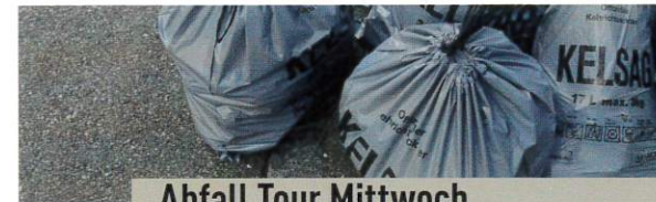
Abfall Tour Mittwoch

Der Kehricht muss vor 07.00 Uhr, am Verschiebedatum bereits ab 06.00 Uhr für die Sammel tour bereit stehen.